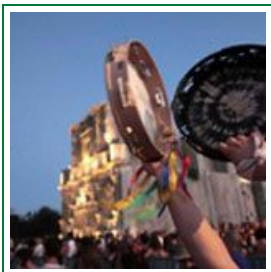
La Notte della Taranta 2012: programma e info